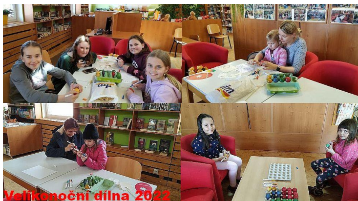
Velikonoční dílna 2022

Od pondělí 4. dubna do čtvrtka 14. dubna 2022 se v knihovně opět po dvou letech konala v odpoledních hodinách velikonoční dílna pro děti.