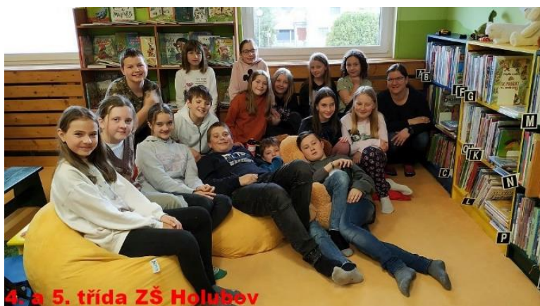
4. a 5. třída ZŠ Holubov

V úterý 29. března 2022 navštívili knihovnu žáci 2. a 3. třídy ZŠ a MŠ Holubov.