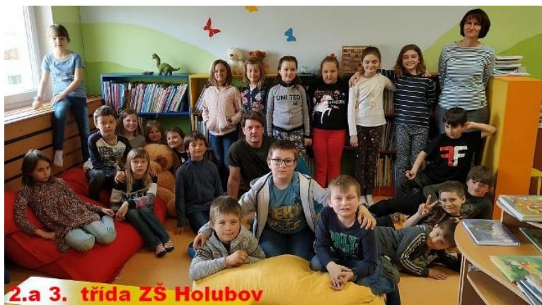
2.a 3. třída ZŠ Holubov

V úterý 29. března 2022 navštívili knihovnu žáci 2. a 3. třídy ZŠ a MŠ Holubov.